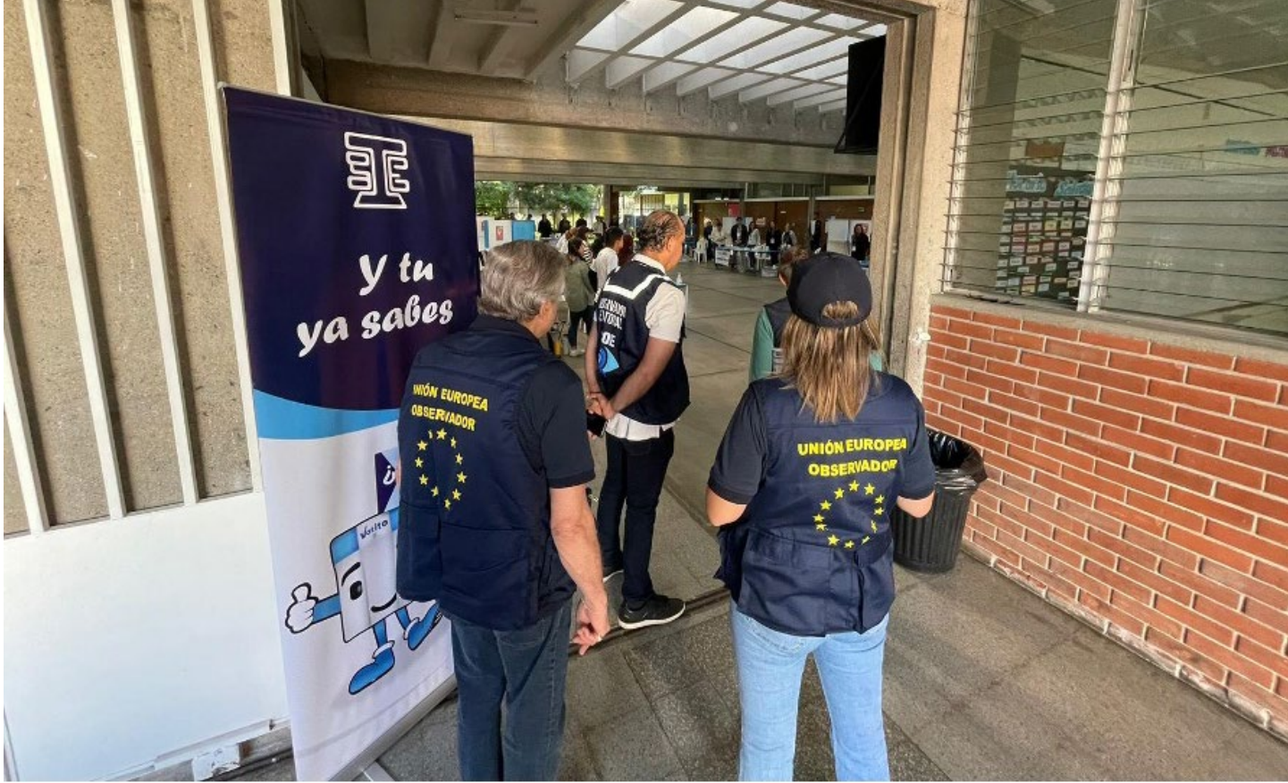
► EINE WAHLBEOBACHTUNGSMISSION IN GUATEMALA, 2023