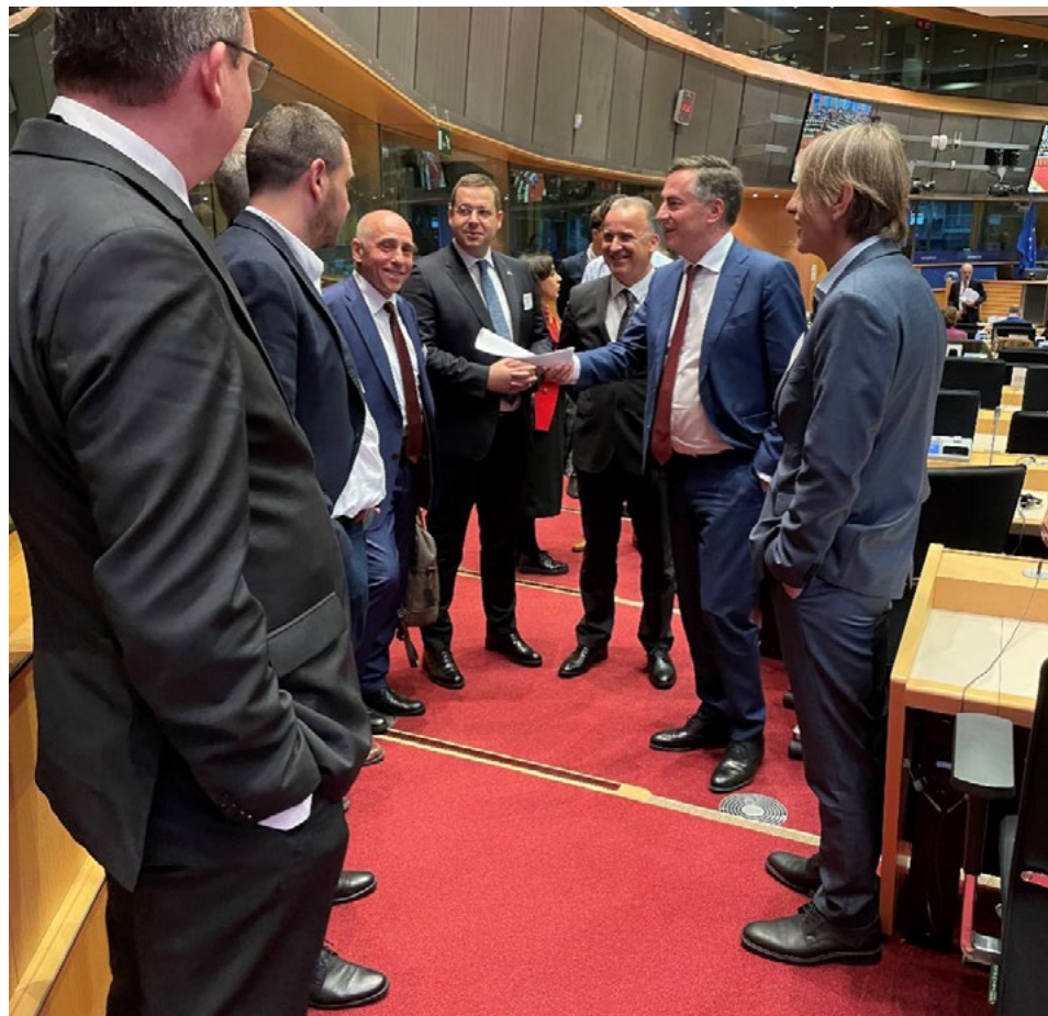
► STUDIENBESUCH VON MITGLIEDERN DES PARLAMENTS VON BOSNIEN UND HERZEGOWINA

Darüber hinaus gibt es zusätzliche Programme, die sich spezifischeren Themen widmen, etwa der Stärkung der Rolle von Parlamentarierinnen und dem Vorgehen gegen Fehlinformationen.